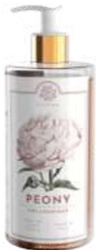
SAPONE LIQUIDO 500 ML 312096 / PP 9,40€