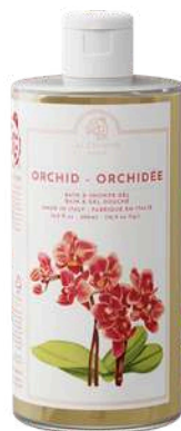
BATH & SHOWER GEL 500 ML