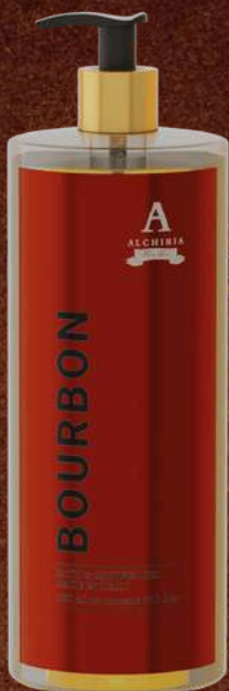
BOURBON BATH & SHOWER GEL 1LT