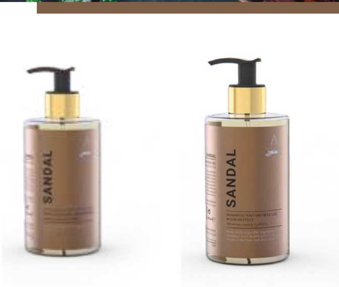
SAPONE LIQUIDO 340 ML 312221 / PP 9,40 €