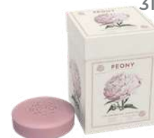
BOX 3 SAPONI SOLIDI 150 GR CAD