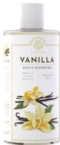
BATH & SHOWER GEL 500 ML