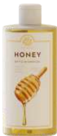
BATH & SHOWER GEL 500 ML