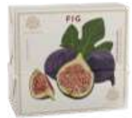
SAPONE SOLIDO 200 GR 312104 / PP 6,80€