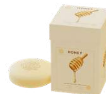
BOX 3 SAPONI SOLIDI 150 GR CAD