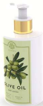
CREMA FLUIDA CORPO 300 ML 312074 / PP 12,60€