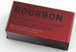
SAPONE SOLIDO 250 GR