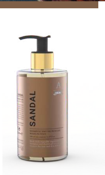
BATH & SHOWER GEL 340 ML 312222 / PP 11,40 €