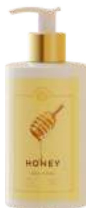
CREMA FLUIDA CORPO 300 ML