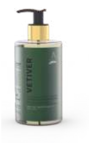
SAPONE LIQUIDO 340 ML