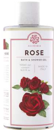
BATH & SHOWER GEL 500 ML 312027 / PP 11,40€