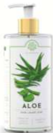
SAPONE LIQUIDO 500 ML 312052 / PP 9,40€