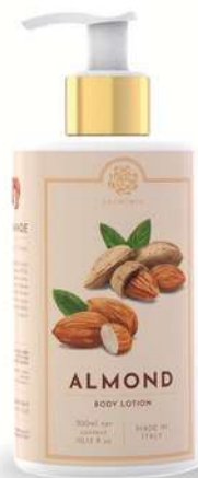
CREMA FLUIDA CORPO 300 ML 312064 / PP 12,60€