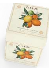
BOX 3 SAPONI SOLIDI 150 GR CAD