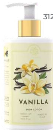
CREMA FLUIDA CORPO 300 ML