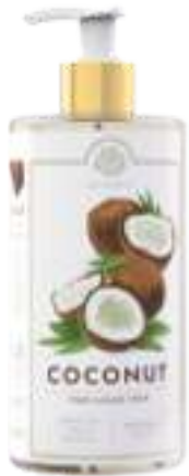
SAPONE LIQUIDO 500 ML 312042 / PP 9,40€