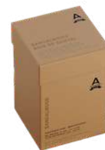
BOX SAPONI 3 X 150 GR