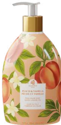
SAPONE LIQUIDO PESCA E VANIGLIA 500 ML