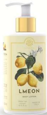
CREMA FLUIDA CORPO 300 ML 312014 / PP 12,60€