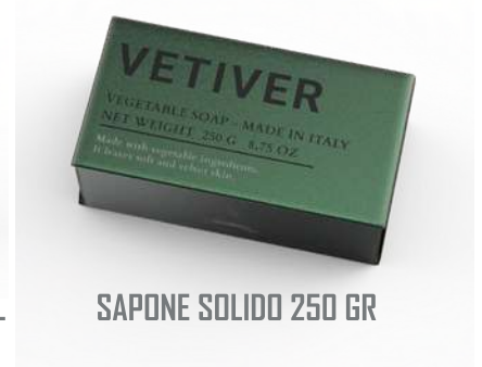
SAPONE SOLIDO 250 GR