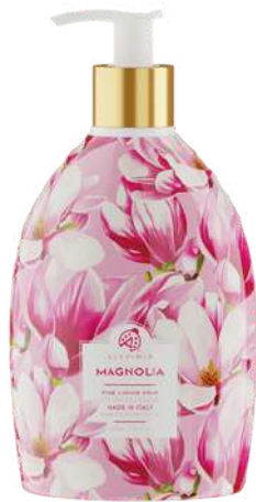
SAPONE LIQUIDO MAGNOLIA 500 ML