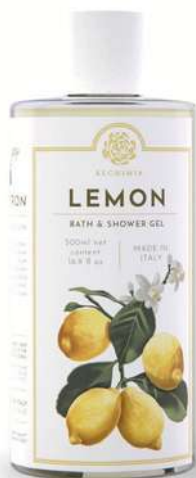
BATH & SHOWER GEL 500 ML 312013 / PP 11,40€