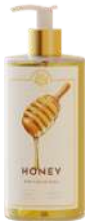
SAPONE LIQUIDO 500 ML

Questa nuova linea incorpora tutte le virtù del miele e le rilascia sulla pelle, donandole vigore, lucentezza e tonicità.