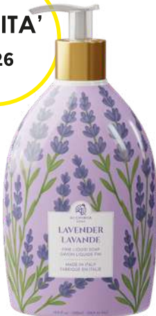
SAPONE LIQUIDO LAVANDA 500 ML