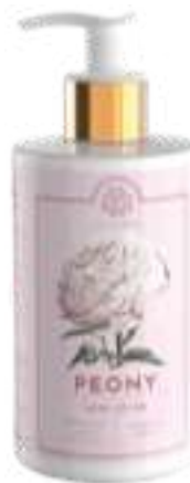
CREMA FLUIDA CORPO 300 ML 312098 / PP 12,60€