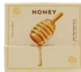
SAPONE SOLIDO 200 GR