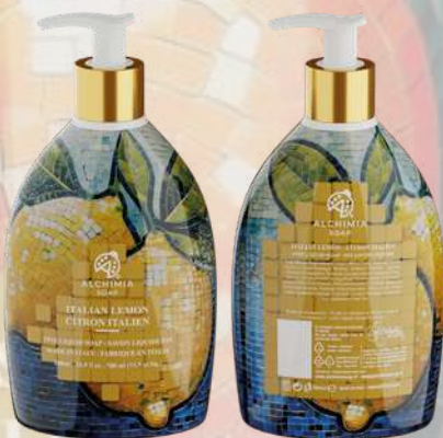
SAPONE LIQUIDO ITALIAN LEMON 500 ML