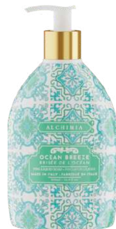
SAPONE LIQUIDO OCEAN BREEZE 500 ML