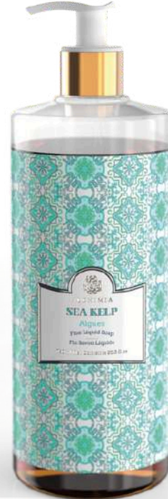
SAPONE LIQUIDO SEA KELP 750 ML