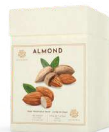
BOX 3 SAPONI SOLIDI 150 GR CAD