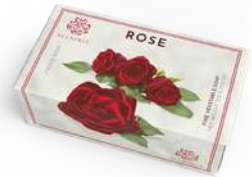
SAPONE SOLIDO 200 GR 312025 / PP 6,80€