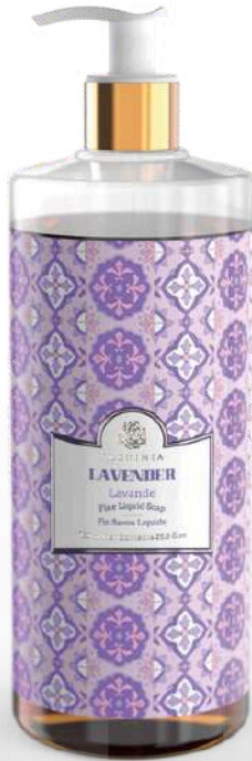
SAPONE LIQUIDO LAVANDER 750 ML