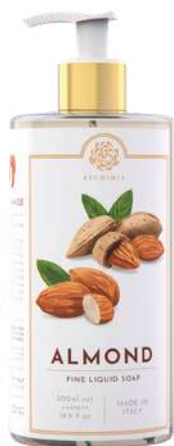
SAPONE LIQUIDO 500 ML 312062 / PP 9,40€