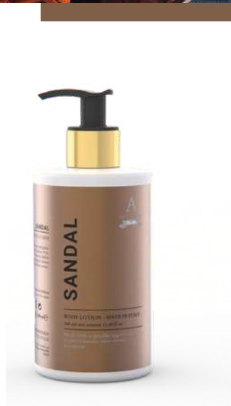
CREMA FLUIDA CORPO 340 ML 312030 / PP 12,60 €