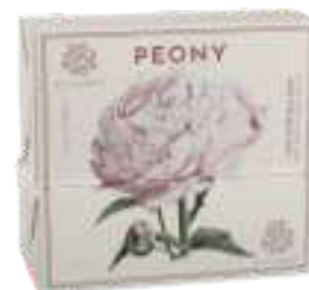
SAPONE SOLIDO 200 GR 312095 / PP 6,80€