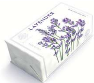
SAPONE SOLIDO 200 GR 312056 / PP 6,90€