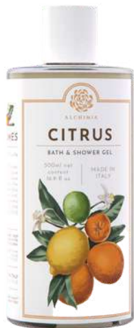
BATH & SHOWER GEL 500 ML 312003 / PP 11,40€