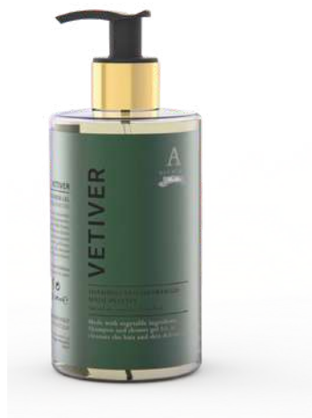
BATH & SHOWER GEL 340 ML