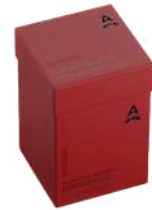
BOX SAPONI 3 X 150 GR