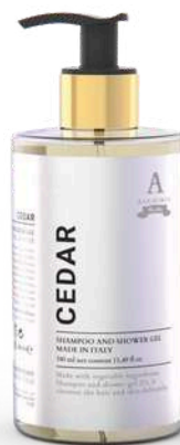
CREMA FLUIDA CORPO 340 ML 312047 / PP 12,60€