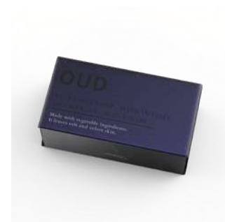
SAPONE SOLIDO 250 GR 312108 / PP 8,20 €