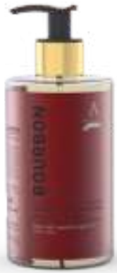
SAPONE LIQUIDO 340 ML