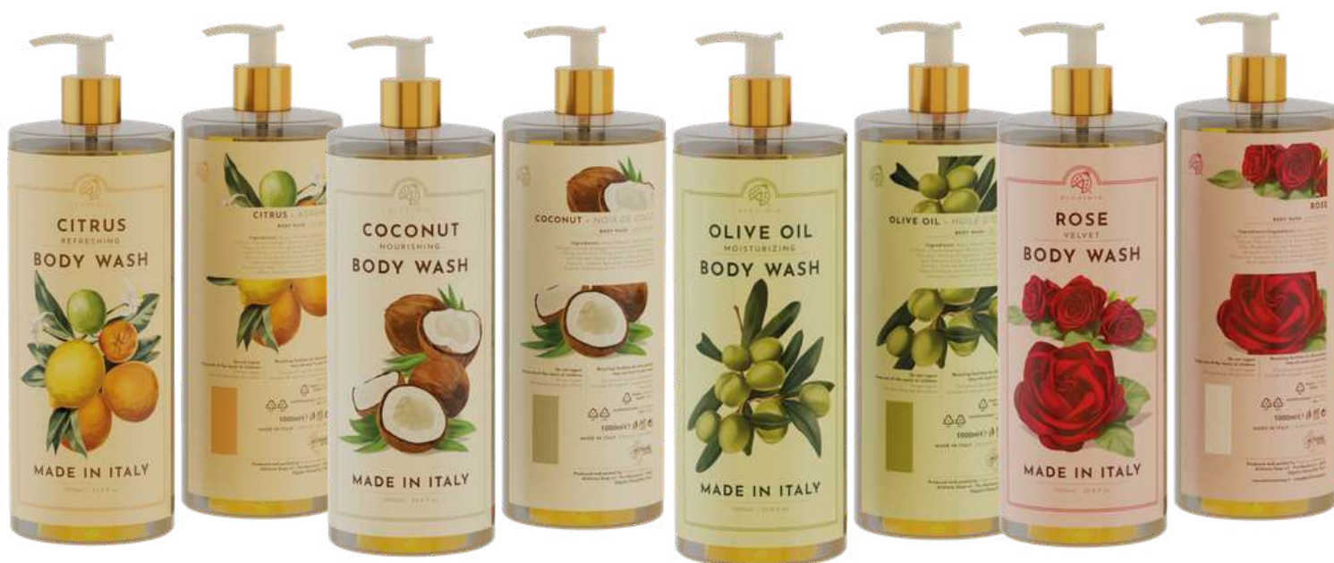
BODY WASH CITRUS 1000 ML