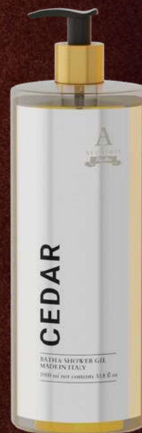
CEDAR BATH & SHOWER GEL 1LT