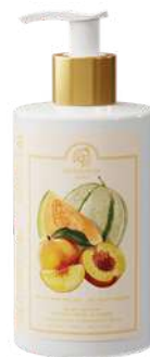
CREMA FLUIDA CORPO 300 ML