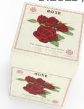
BOX 3 SAPONI SOLIDI 150 GR CAD