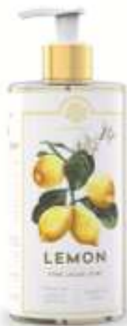
SAPONE LIQUIDO 500 ML 312012 / PP 9,40€