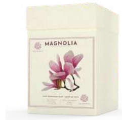
BOX 3 SAPONI SOLIDI 150 GR CAD