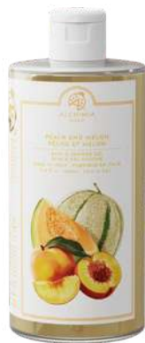
BATH & SHOWER GEL 500 ML