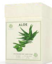
BOX 3 SAPONI SOLIDI 150 GR CAD