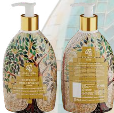
SAPONE LIQUIDO OLIVE OIL 500 ML