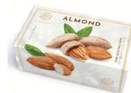
SAPONE SOLIDO 200 GR 312061 / PP 6,80€