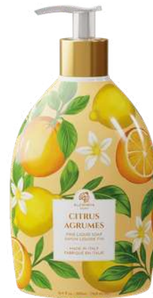
SAPONE LIQUIDO CITRUS - AGRUMI 500 ML