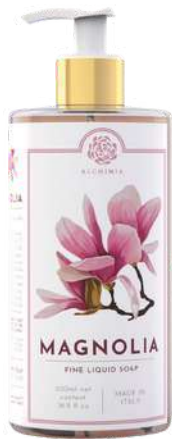
SAPONE LIQUIDO 500 ML