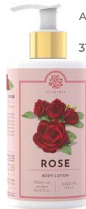
CREMA FLUIDA CORPO 300 ML 312028 / PP 12,60€