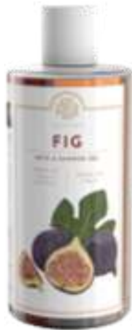
BATH & SHOWER GEL 500 ML 312106 / PP 11,40€