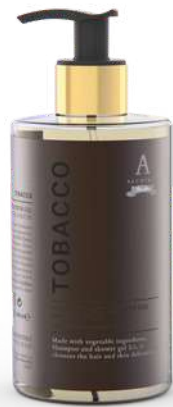
BATH & SHOWER GEL 340 ML 312202 / PP 11,40 €