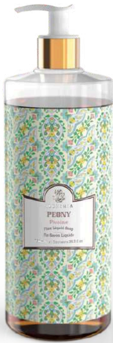
SAPONE LIQUIDO PEONY 750 ML