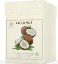
BOX 3 SAPONI SOLIDI 150 GR CAD