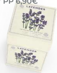
BOX 3 SAPONI SOLIDI 150 GR CAD