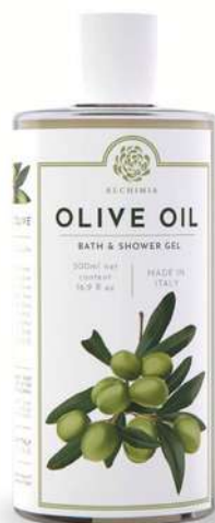
BATH & SHOWER GEL 500 ML 312073 / PP 11,40€