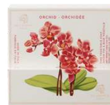
SAPONE SOLIDO 200 GR