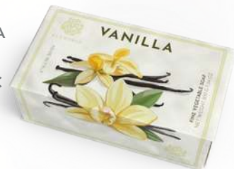
SAPONE SOLIDO 200 GR