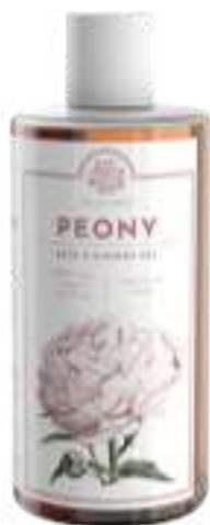
BATH & SHOWER GEL 500 ML 312097 / PP 11,40€