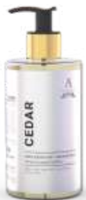
SAPONE LIQUIDO 340 ML 312213 / PP 9,40€