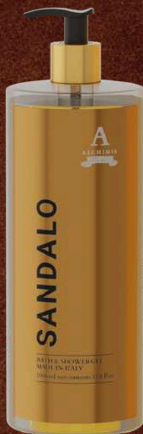
SANDALO BATH & SHOWER GEL 1LT