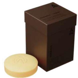
BOX SAPONI 3 X 150 GR