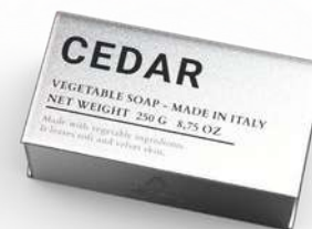
SAPONE SOLIDO 250 GR 312112 / PP 8,20€