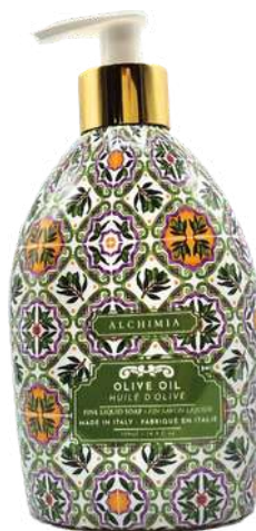
SAPONE LIQUIDO OLIVE OIL 500 ML