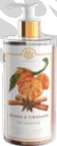
SAPONE LIQUIDO 500 ML 312101 / PP 9,40€