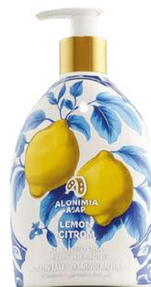
SAPONE LIQUIDO LIMONE BLU 500 ML