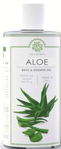
BATH & SHOWER GEL 500 ML 312053 / PP 11,40€