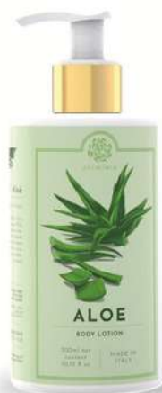
CREMA FLUIDA CORPO 300 ML 312054 / PP 12,60€