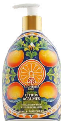
SAPONE LIQUIDO CIRTUS - AGRUMI 500 ML