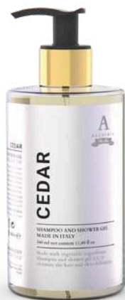
BATH & SHOWER GEL 340 ML 312046 / PP 11,40€