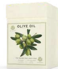
BOX 3 SAPONI SOLIDI 150 GR CAD