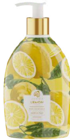
SAPONE LIQUIDO LIMONE 500 ML