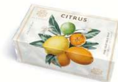
SAPONE SOLIDO 200 GR 312001 / PP 6,80€