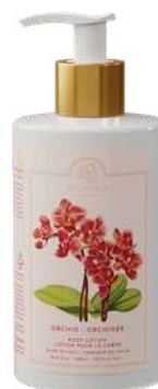
CREMA FLUIDA CORPO 300 ML