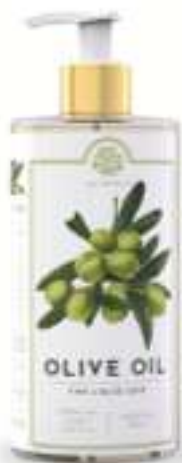
SAPONE LIQUIDO 500 ML 312072 / PP 9,40€