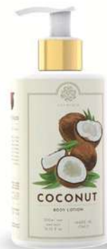
CREMA FLUIDA CORPO 300 ML 312044 / PP 12,60€