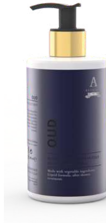
CREMA FLUIDA CORPO 340 ML 312263 / PP 12,60 €