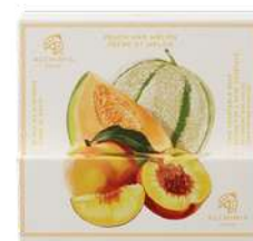
SAPONE SOLIDO 200 GR