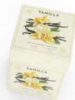
BOX 3 SAPONI SOLIDI 150 GR CAD