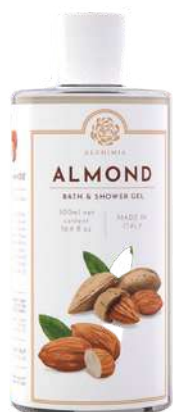
BATH & SHOWER GEL 500 ML 312063 / PP 11,40€