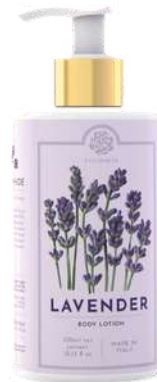
CREMA FLUIDA CORPO 300 ML 312024 / PP 12,60€