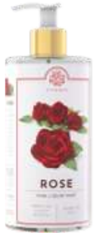
SAPONE LIQUIDO 500 ML 312026 / PP 9,40€