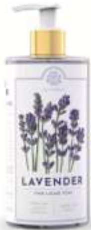
SAPONE LIQUIDO 500 ML 312022 / PP 9,40€