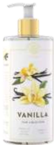
SAPONE LIQUIDO 500 ML