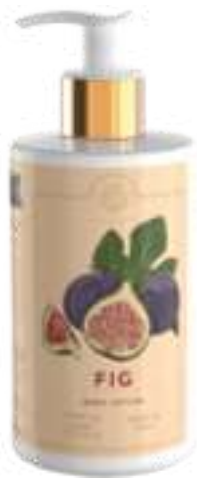
SAPONE LIQUIDO 500 ML 312105 / PP 9,40€