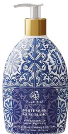
SAPONE LIQUIDO MUSCHIO BIANCO 500 ML