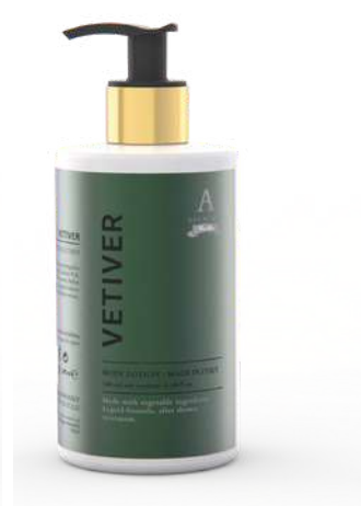
CREMA FLUIDA CORPO 340 ML