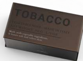
SAPONE SOLIDO 250 GR 312200 / PP 8,20 €