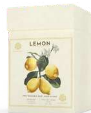
BOX 3 SAPONI SOLIDI 150 GR CAD