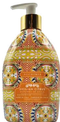
SAPONE LIQUIDO SICILIAN CITRUS 500 ML