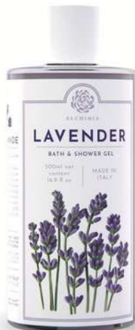
BATH & SHOWER GEL 500 ML 312023 / PP 11,40€