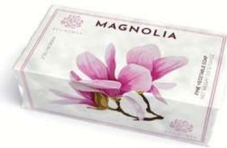
SAPONE SOLIDO 200 GR