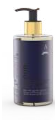
SAPONE LIQUIDO 340 ML 312109 / PP 9,40 €