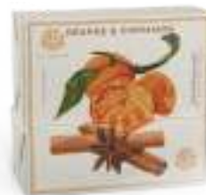
SAPONE SOLIDO 200 GR 312100 / PP 6,80€