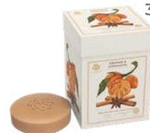
BOX 3 SAPONI SOLIDI 150 GR CAD