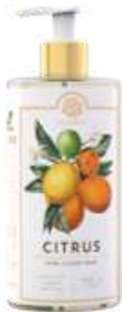
SAPONE LIQUIDO 500 ML 312002 / PP 9,40€