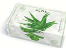
SAPONE SOLIDO 200 GR 312051 / PP 6,80€