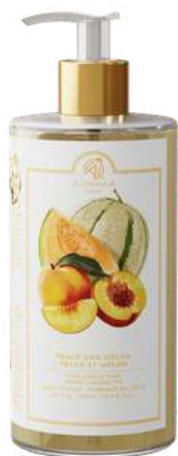
SAPONE LIQUIDO 500 ML