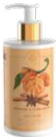
CREMA FLUIDA CORPO 300 ML 312103 / PP 12,60€