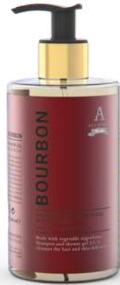
BATH & SHOWER GEL 340 ML