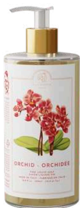
SAPONE LIQUIDO 500 ML