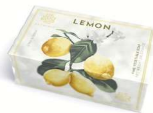
SAPONE SOLIDO 200 GR 312011 / PP 6,80€