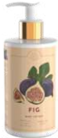
CREMA FLUIDA CORPO 300 ML 312107 / PP 12,60€