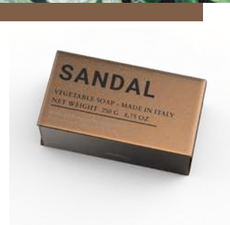
SAPONE SOLIDO 250 GR 312220 / PP 8,20 €