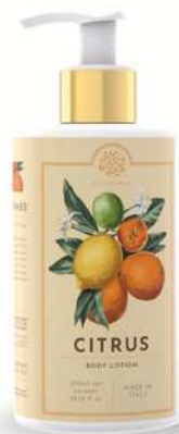
CREMA FLUIDA CORPO 300 ML 312004 / PP 12,60€