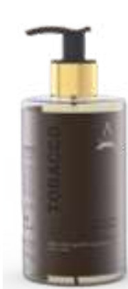
SAPONE LIQUIDO 340 ML 312050 / PP 9,40 €