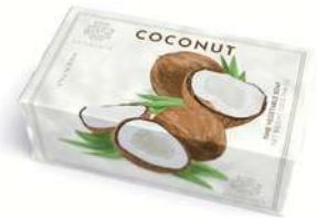
SAPONE SOLIDO 200 GR 312041 / PP 6,80€