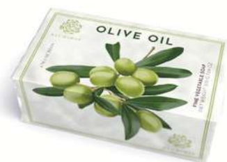
SAPONE SOLIDO 200 GR 312071 / PP 6,80€