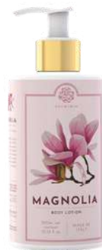
CREMA FLUIDA CORPO 300 ML