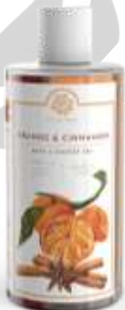
BATH & SHOWER GEL 500 ML 312102 / PP 11,40€