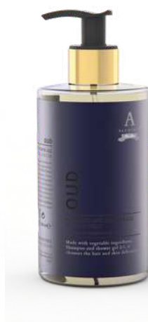
BATH & SHOWER GEL 340 ML 312110 / PP 11,40 €