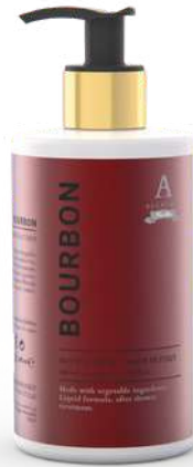
CREMA FLUIDA CORPO 340 ML