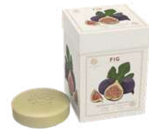
BOX 3 SAPONI SOLIDI 150 GR CAD