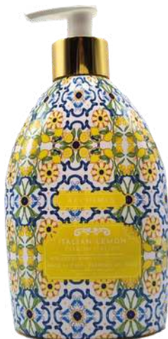
SAPONE LIQUIDO ITALIAN LEMON 500 ML