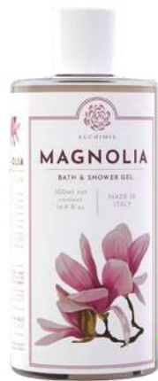
BATH & SHOWER GEL 500 ML