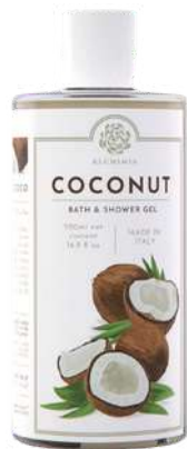
BATH & SHOWER GEL 500 ML 312043 / PP 11,40€