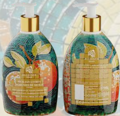
SAPONE LIQUIDO SICILIAN CITRUS 500 ML